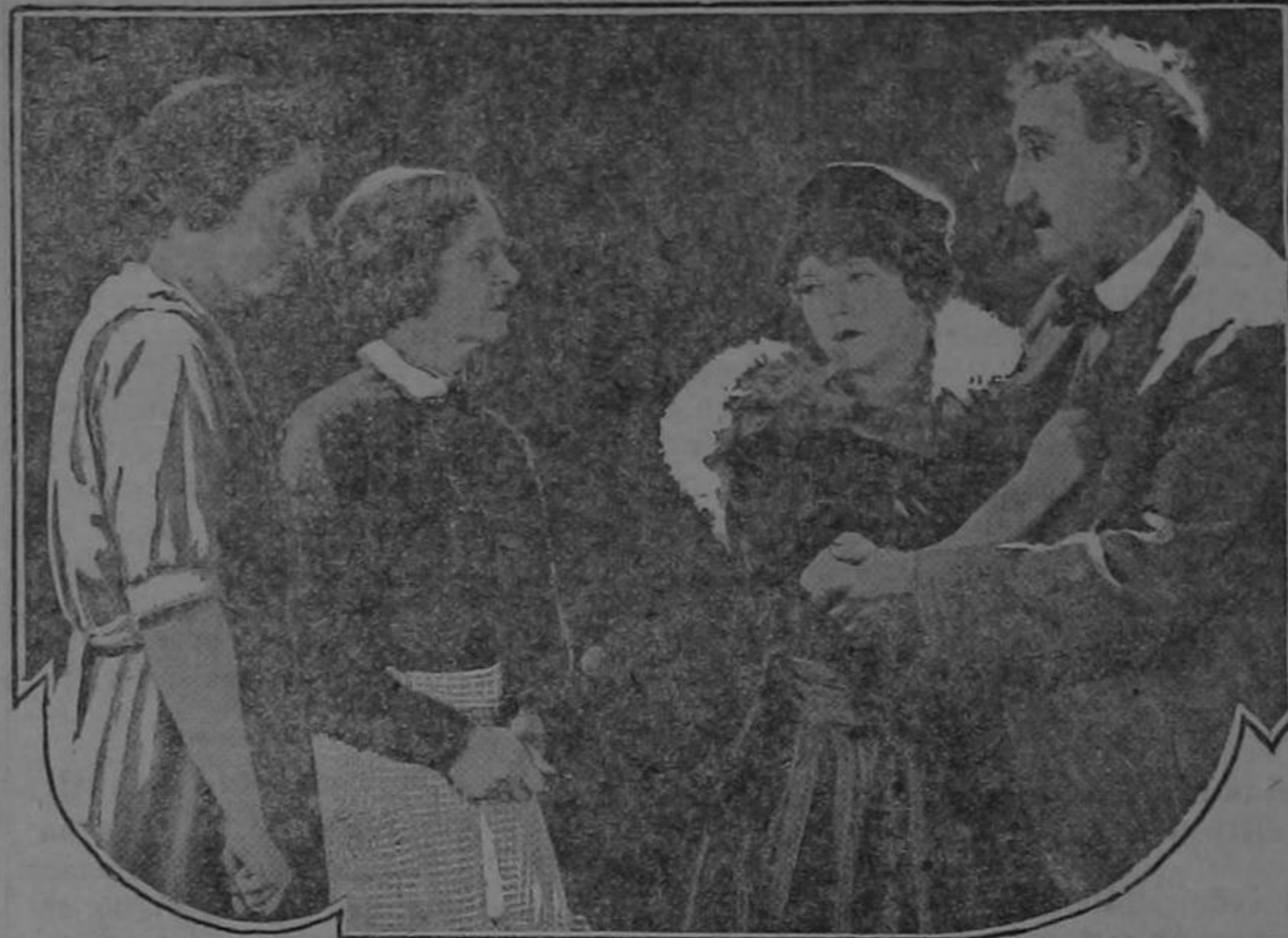
Scene from "THE FLIRT" - UNIVERSAL-JEWEL PICTURE WITH AN ALL STAR CAST