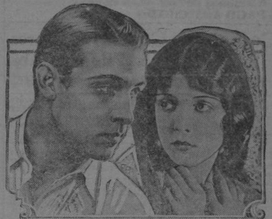
Rodolph Valentino and Lila Lee in scene from the Paramount Picture, "Blood and Sand"