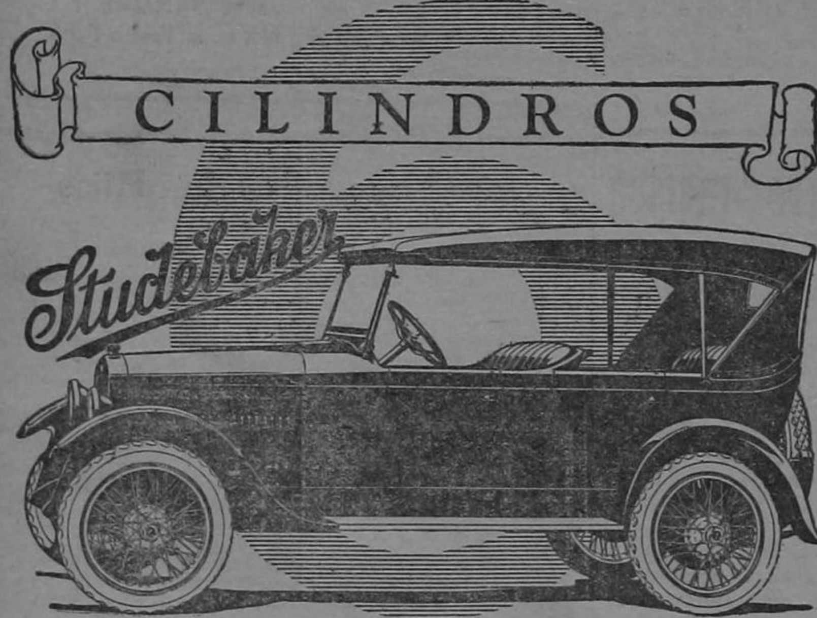
Studebaker Light-Six de Turismo, 5 asientos, $0000

La Studebaker se especializa en la manufactura de automóviles de seis cilindros exclusivamente. Como los modelos Big-Six, Special-Six y Light-Six están equipados con motores de seis cilindros, cada uno de ellos posee esas ventajas con que se identifican los coches finos en todo el mundo; aceleración rápida, abundancia de fuerza motriz, uniformidad en su carrera y ausencia de vibración.