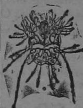
Parásito de la sarna aumento: 600 veces